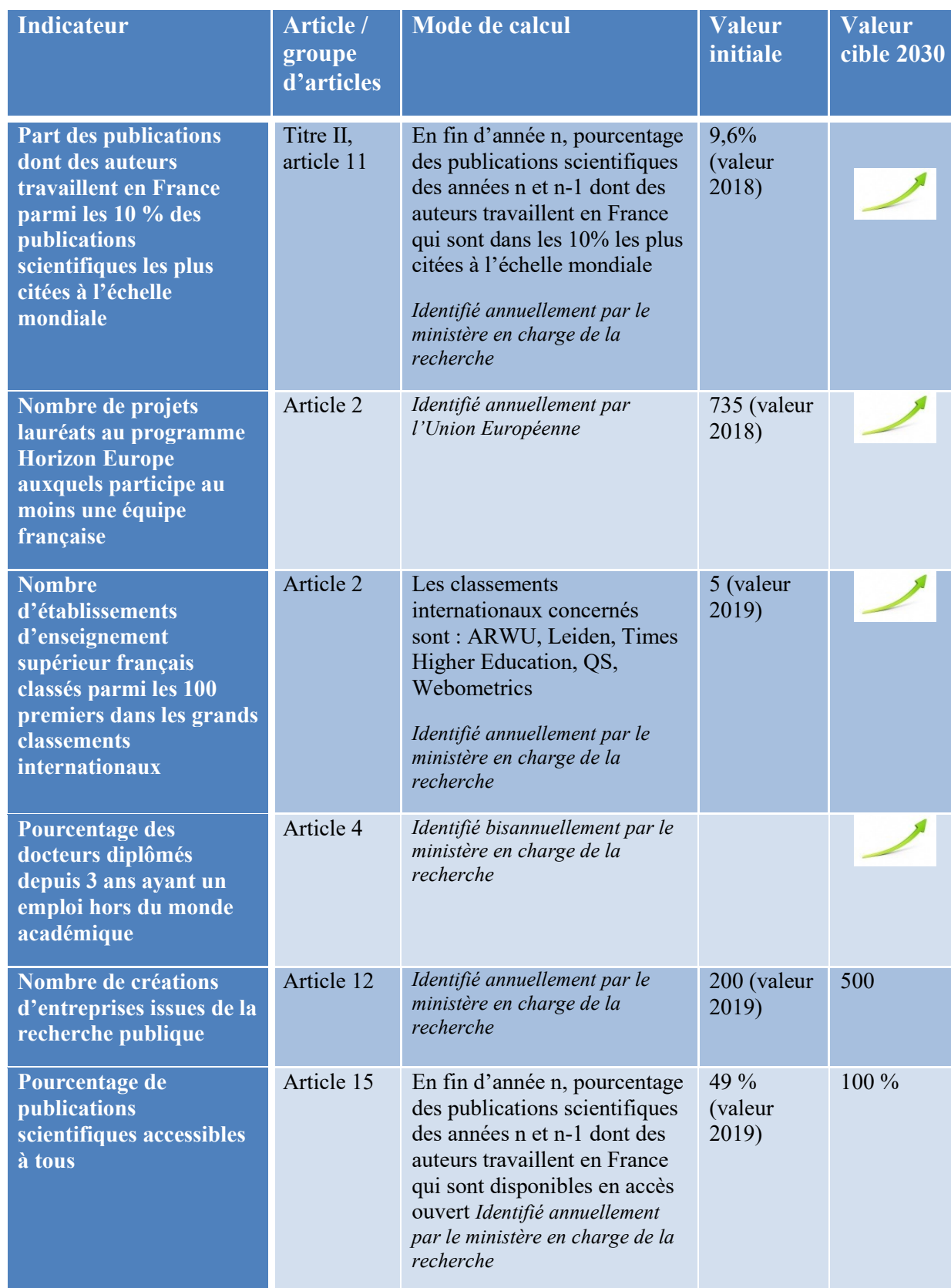
Tableau des indicateurs d'impact